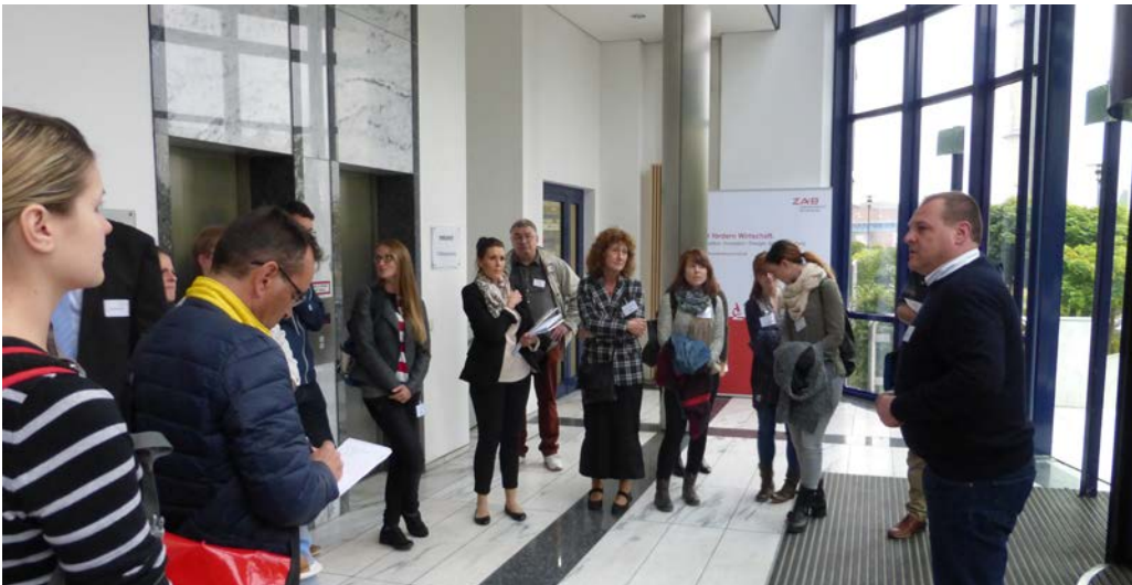
[Beginn der Unternehmensführungen]