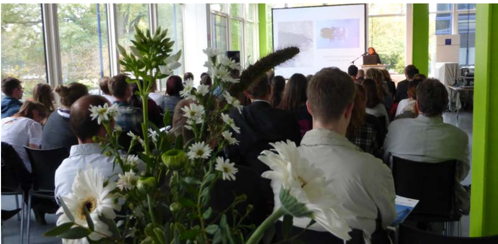
Teilnehmer_innen der Health Week am 7.10.2015

Die Hauptstadtregion gehört im Bereich Gesundheitswirtschaft zu den führenden Standorten Europas. Im Rahmen der Veranstaltungswoche vom 07.10. bis 15.10.2015 wurden Innovationen für den globalen Gesundheitsmarkt, neue Therapien und die Macher dahinter vorgestellt. Im RWK O-H-V lag der Fokus im Jahr 2015 auf der Vorstellung am Standort ansässiger innovativer Unternehmen, ihrer aktuellen Forschungsprojekte und Entwicklungen sowie bestehender Arbeitsmöglichkeiten und Fachkräftebedarfe.