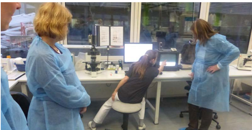
[Mitarbeiter erläutern die Vorgehensweise bei der Erregeridentifizierung und Resistenztestung]