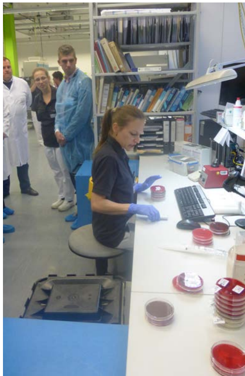
[Demonstration einer Bakterienbestimmung (r.)]