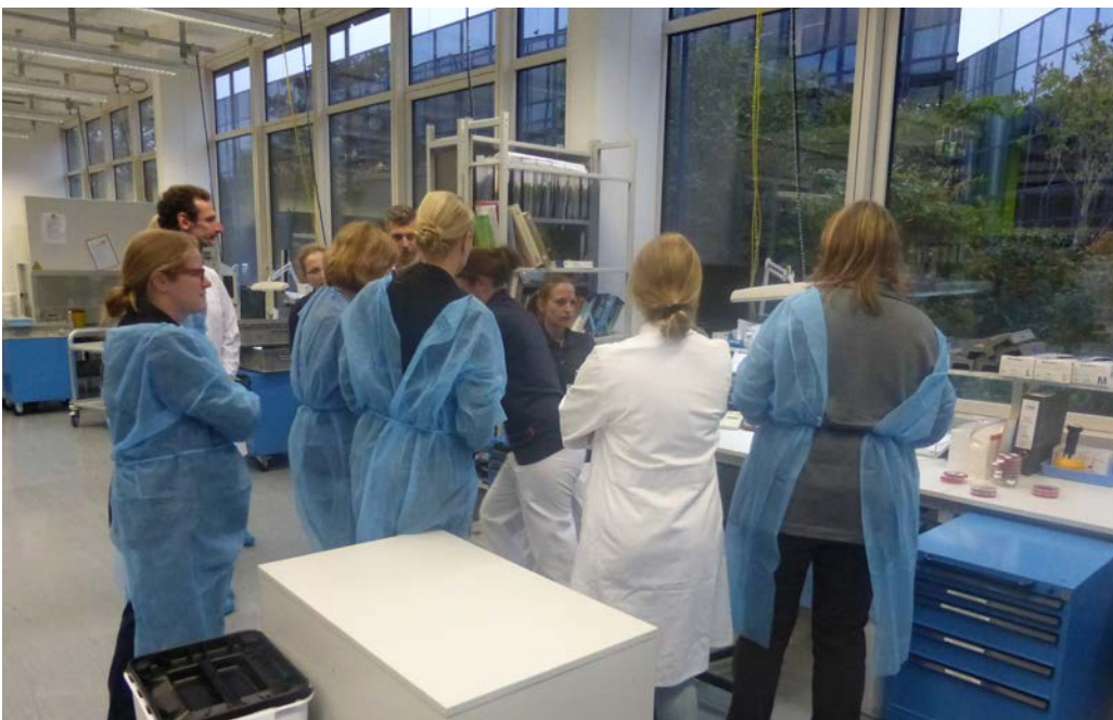
[Teilnehmer_innen werden unterschiedliche Analyseverfahren erläutert und demonstriert]